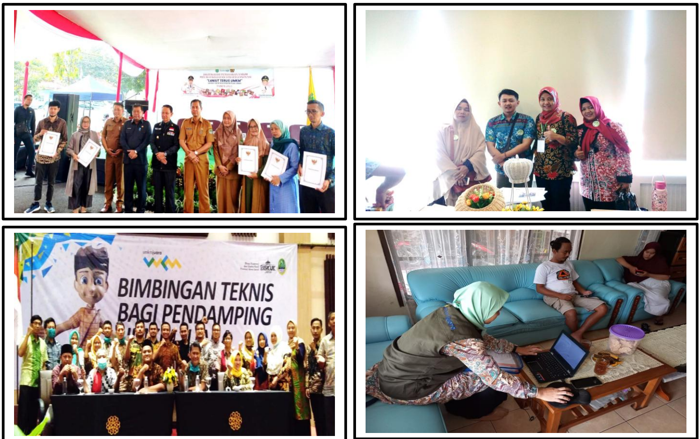
Gambar 3. Kegiatan Pendampingan UMKM di Kabupaten Majalengka

mewujudkan UMKM Go Global yaitu memfasilitasi pelatihan dan pendampingan pelaku usaha bertujuan agar UMKM bisa menghasilkan produk berkualitas global dengan harga yang kompetitif, sehingga tidak kalah dengan produk impor yang masuk ke pasar dalam negeri dan bisa bersaing di pasar global disesuaikan dengan target segmen pasar masing-masing. Inovasi pada program ini adalah mendorong agar UMKM memiliki badan usaha; mempunyai perizinan/sertifikat standar yang disetujui dan diverifikasi; dilengkapi katalog produk dan company profile dalam bahasa Inggris; ada SOP; serta mampu memproduksi dalam skala besar dan siap untuk masuk ke pangsa ekspor yang difasilitasi oleh Dinas Koperasi dan Usaha Kecil Provinsi Jawa Barat, Dinas Ketenagakerjaan, Koperasi, Usaha Kecil dan Menengah Kabupaten Majalengka, Akademisi dan Praktisi Pendamping UMKM Juara serta Off Taker yang memiliki jejaring ekspor seperti Enturk Trading Hepsi Global untuk pangsa pasar ke Turki (Dinas Koperasi dan Usaha Kecil Jawa Barat, 2024).