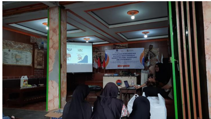
Gambar 4. Pemaparan Materi Literasi Keuangan