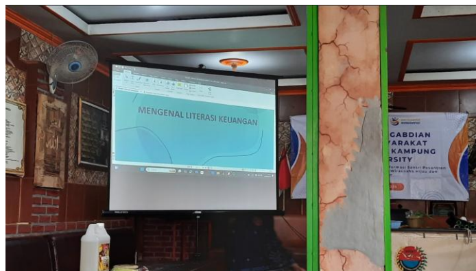
Gambar 3. Pemaparan Materi Literasi Keuangan