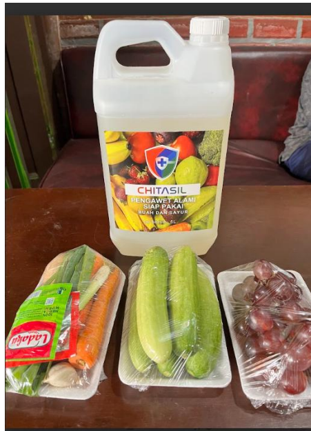
Gambar 2. Hasil Packaging Premium