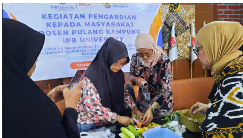
Gambar 1 . Proses Pembuatan Packaging Premium

Temuan ini menunjukkan bahwa inovasi pengemasan mampu meningkatkan nilai jual hasil pertanian. sebagaimana dinyatakan oleh effendy & kurniawati (2023), strategi value-added packaging berperan penting dalam meningkatkan daya saing produk pertanian lokal pada pasar tradisional maupun modern.