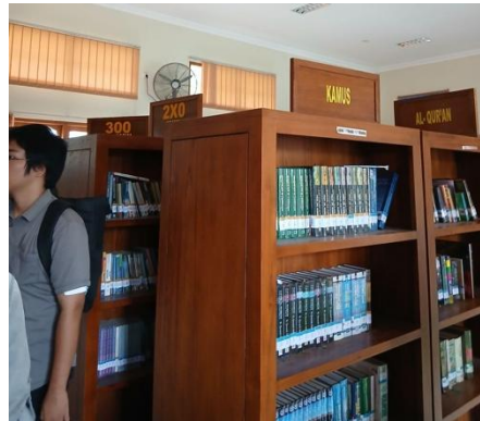
Gambar 7. Perpustakaan Pondok Pesantren Pabelan Magelang

ditanamkan agar santri memiliki semangat belajar yang tidak terbatas oleh waktu, menjadikan mereka pribadi yang terus berkembang dan berkontribusi bagi masyarakat.