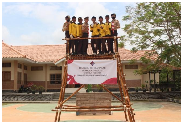
Gambar 5. Central Java Scout Festival (Balai Pendidikan PP Pabelan, 2021)

Selain pawai, kegiatan budaya lain yang diadakan oleh PP Pabelan adalah Central Java Scout Festival ( Gambar 5 ). Lomba festival ini diadakan untuk seluruh siswa Sekolah Menengah Atas Kwartir Daerah Provinsi Jawa Tengah untuk berlomba di bidang kepramukaan di PP Pabelan. Contoh Lomba festival ini misalnya pada tahun 2021 diadakan dengan tema pioneering aplikatif dan teknologi tepat guna. Para santri PP Pabelan dan para murid perwakilan SMA seluruh Jawa Tengah berlomba untuk mengembangkan teknologi yang aplikatif dan tepat guna. Santri PP Pabelan pada lomba festival tersebut membuat menara pandang dan alat fogging minipraktis (Balai Pendidikan PP Pabelan, 2021).