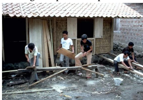
Gambar 3. Pelatihan Pertukangan Santri Pondok Pesantren Pabelan (AKDN, 2025)

Kehidupan asrama di Pondok Pesantren Pabelan juga membangun rasa kebersamaan, kekeluargaan, serta solidaritas di antara para santri di Pondok Pesantren Pabelan Magelang. Selain itu, sistem pendidikan Muallimin yang diterapkan di Pondok Pesantren Pabelan tidak hanya menekankan ilmu agama, tetapi juga keterampilan sosial (seperti pelatihan di bidang pertukangan dan pelatihan di bidang teknologi informasi) kepemimpinan, dan tanggung jawab. Pelatihan di bidang pertukangan dapat dilihat pada Gambar 3 .