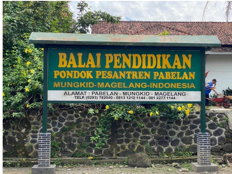
Gambar 1. Pondok Pesantren Pabelan