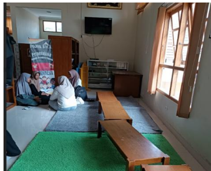
Gambar 8. Kegiatan Santri di Perpustakaan PP Pabelan

Selain itu, kebebasan santri untuk menggunakan perpustakaan dengan jadwal yang terstruktur mencerminkan penghargaan terhadap hak belajar dan akses ilmu pengetahuan ( Gambar 8 ). Penjadwalan yang terorganisir juga menunjukkan perhatian pada keteraturan, ketertiban, serta keadilan dalam pembagian waktu dan ruang, yang semuanya merupakan ekspresi dari kasih sayang institusional terhadap para santri agar mereka dapat tumbuh optimal.