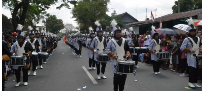
Gambar 4. Pawai Pabelan Drum Corps sebagai Pelestarian Budaya PP Pabelan (Balai Pendidikan PP Pabelan, 2017)

Pondok Pesantren Pabelan juga turut memajukan budaya baik untuk para santri dan untuk warga Muntilan misalnya melalui adanya tim pawai marching band Pondok Pesantren Pabelan yang diberi nama Pabelan Drum Corps dengan jumlah anggota berkisar 82 anggota. Biasanya Pabelan Drum Corps mengadakan pawai di Kecamatan Muntilan setiap Hari Ulang Tahun Indonesia. Pawai Pabelan Drum Corps dapat dilihat pada Gambar 4 sebagai berikut ini: