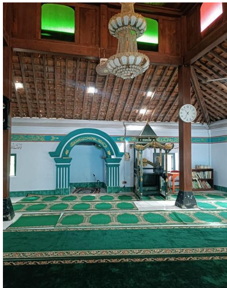
Gambar 6. Masjid Pondok Pesantren Pabelan Magelang

Masjid di Pondok Pesantren Pabelan ( Gambar 6 ) tidak hanya berfungsi sebagai tempat shalat, tetapi juga menjadi pusat pembinaan spiritual dan moral santri. Dari masjid, nilai ketaatan kepada Allah diajarkan dan diamalkan melalui ibadah yang rutin, mencerminkan komitmen khalifah dalam menjalankan perintah Tuhan. Selain itu, masjid menjadi wadah untuk menyebarkan nilai-nilai keadilan dan kedamaian melalui dakwah dan pembinaan akhlak. Kebersamaan dan ukhuwah antar santri juga tumbuh kuat di masjid, membentuk solidaritas dan persatuan yang mencerminkan kehidupan masyarakat Islami. Nilai khilafah juga tercermin pada peran pemimpin yang bijak, melalui khutbah dan ceramah yang disampaikan oleh para ustaz dan kyai di masjid PP Pabelan sebagai bentuk bimbingan rohani dan sosial kepada para santri PP Pabelan.