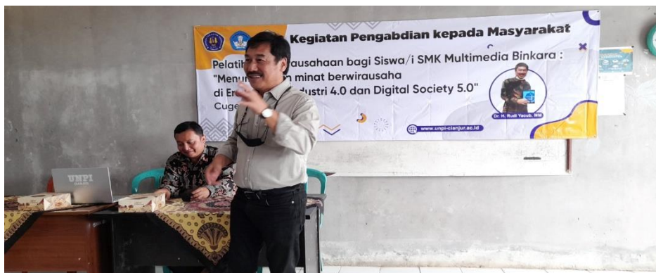
Gambar.3 Foto saat pemberian materi kepada peserta pengabdian