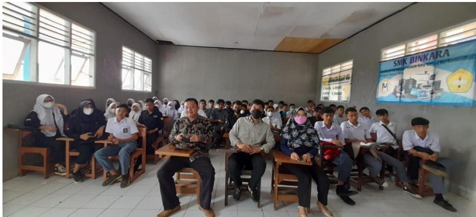
Gambar. 2 Foto Bersama Peserta Kegiatan Pengabdian

Dalam lingkungan yang mendukung dan kreatif, anak-anak SMK akan merasa didorong untuk mengembangkan ide-ide bisnis mereka sendiri. Mereka akan melihat wirausaha sebagai pilihan karir yang menarik dan bermanfaat. Dukungan dari sekolah, perusahaan, dan peran model yang menginspirasi akan membantu mereka mengatasi ketakutan dan tantangan yang terkait dengan memulai bisnis. Dalam jangka panjang, menumbuhkan minat wirausaha pada anak SMK dapat membantu mengurangi angka pengangguran dan meningkatkan pertumbuhan ekonomi. Anak-anak SMK yang memiliki minat wirausaha yang kuat akan memiliki kesempatan untuk menciptakan peluang kerja bagi diri mereka sendiri dan orang lain. Mereka juga dapat berkontribusi pada inovasi dan perkembangan industri di negara mereka. Berikut merupakan dokumentasi kegiatan pengabdian.