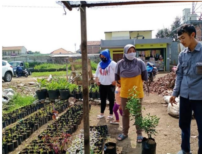
Gambar 1. ( penyuluhan )

Penyuluhan dari narasumber ini bertujuan untuk memberikan pembekalan materi kepada penduduk di Kelurahan Citeureup yang dapat mengedukasi penduduk tersebut mengenai komposting, sehingga pada waktu pelatihan atau workshop mereka dapat mempraktekkannya sendiri.