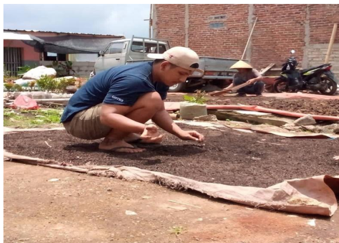
Gambar 2. ( pemilahan sampah )

Metode pelatihan ( workshop ) adalah kegiatan yang disertai dengan demonstrasi atau percontohan untuk menghasilkan keterampilan tertentu. Pada program Pengabdian pada Masyarakat ini, penulis melakukan pelatihan di Kelurahan Citeureup Kota Cimahi melakukan pada tanggal 01 September 2023 di tempat pembuatan Kompos di kelurahan citeureup sebagai sample percontohan,