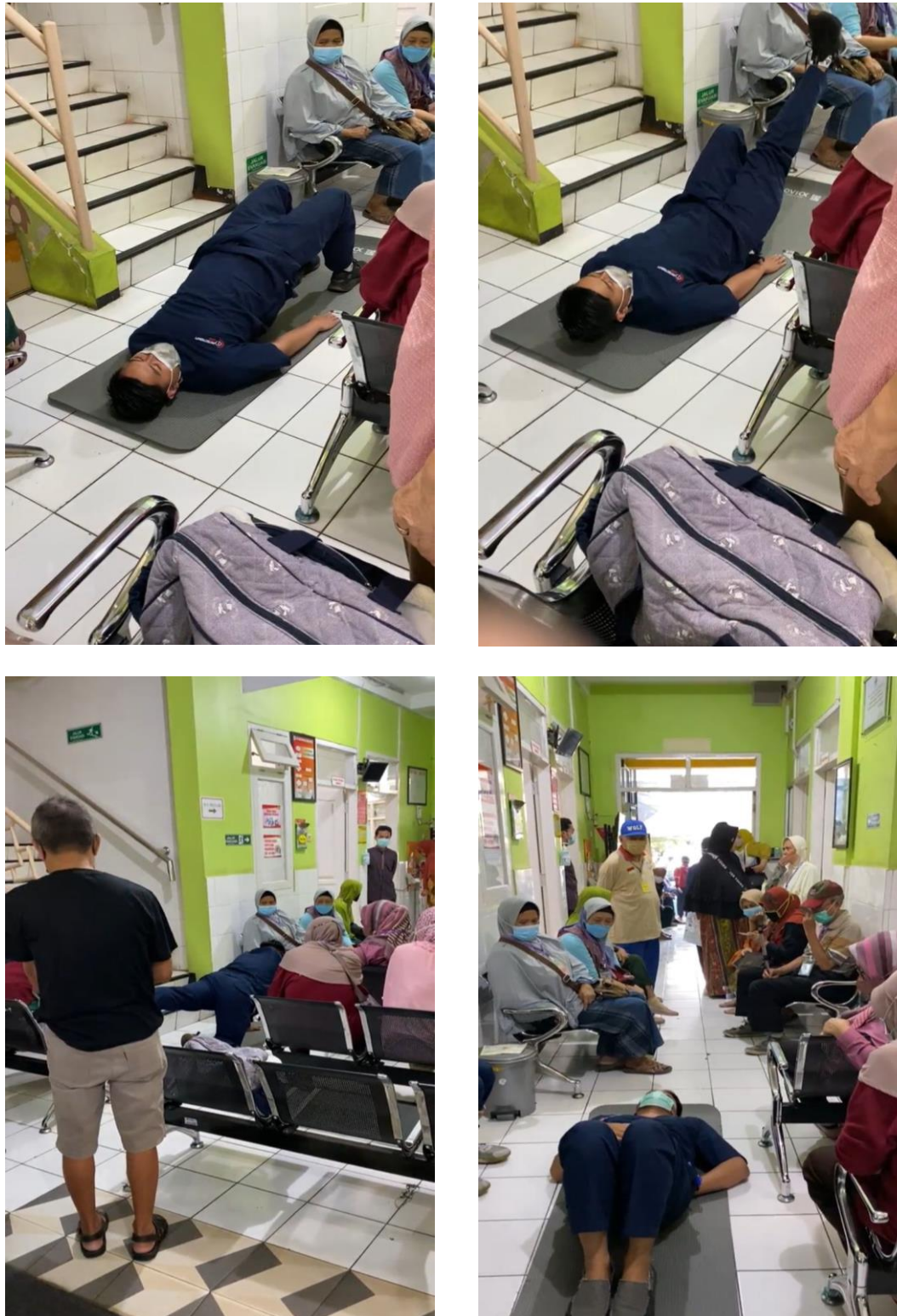
Gambar 3. Latihan Otot Core

Untuk mengukur keberhasilan kegiatan penyuluhan ini, maka dilakukan evaluasi sebelum dan sesudah dilakukannya kegiatan penyuluhan yang telah disajikan pada tabel berikut: