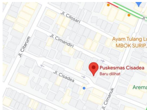
Gambar 1. Lokasi Kegiatan

Kegiatan penyuluhan kepada lansia dilakukan di Puskesmas Cisadea di Jalan Cisadea, Purwantoro, Kecamatan Belimbing, Kota Malang, Jawa Timur pada tanggal 27 Oktober 2023 jam 07.30 - selesai.