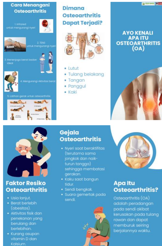
Gambar 2. Leaflet Osteoarthritis