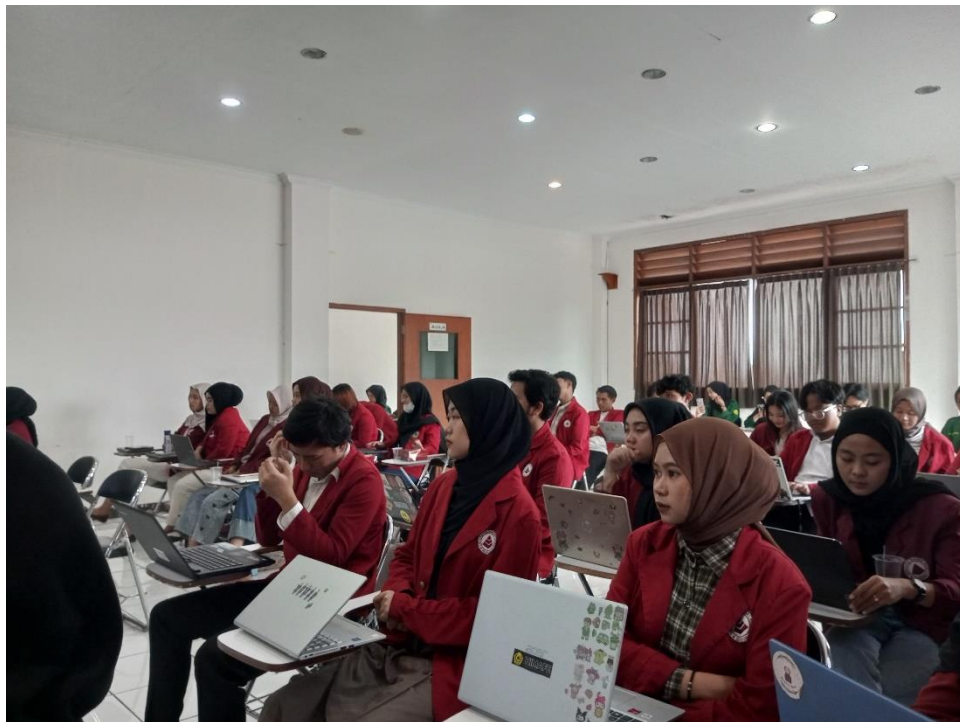
Gambar 3. Peserta Mempraktikkan Penggunaan AI

Selama pelatihan peserta dipandu untuk mencoba masing-masing aplikasi AI, namun sayangnya karena wifi di Aula saat itu sedang tidak stabil sehingga proses praktiknya sedikit terhambat, sehingga sebagian harus menggunakan internet dari mobile phone masing-masing.