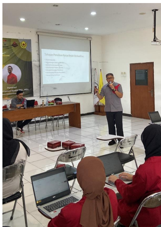
Gambar 4. Penyampaian Materi AI

Selama pelatihan peserta dipandu untuk mencoba masing-masing aplikasi AI, namun sayangnya karena wifi di Aula saat itu sedang tidak stabil sehingga proses praktiknya sedikit terhambat, sehingga sebagian harus menggunakan internet dari mobile phone masing-masing.