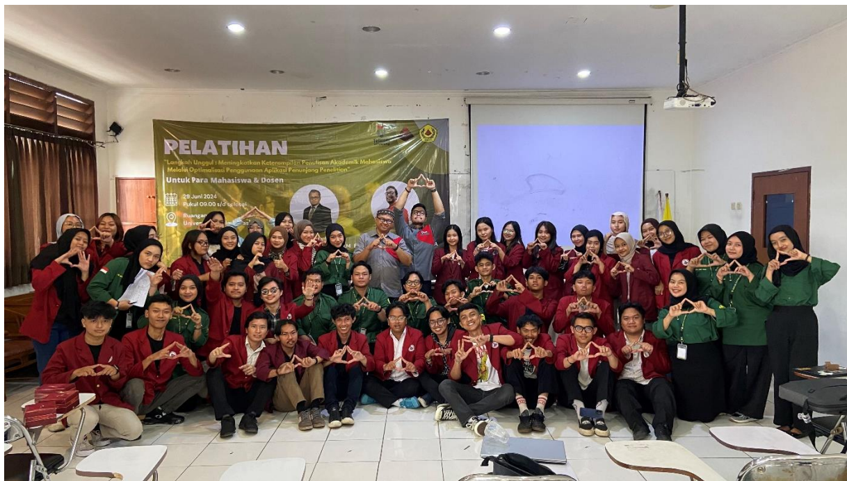
Gambar 2. Foto Bersama Seluruh Peserta

Pada pelatihan ini para peserta diminta untuk membawa laptop, sehingga diharapkan mereka dapat langsung mempraktikkan bagaimana menggunakan berbagai aplikasi yang dapat menunjang dalam penelitian. Sebelumnya dijelaskan oleh narasumber bahwa prinsipnya bahwa AI ini hanyalah alat bantu dan yang utamanya adalah bagaimana peserta dapat menggunakannya secara baik dan beretika sehingga hasil penelitiannya dapat menjadi lebih cepat dituntaskan dan berkualitas.