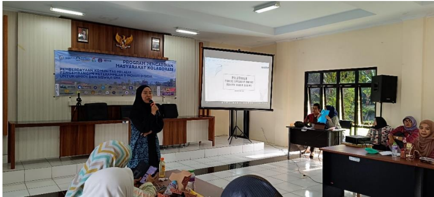
Gambar 3. Penyampaian Materi oleh Dosen

Adapun secara lengkap kegiatan dilaksanakan sebagai berikut;