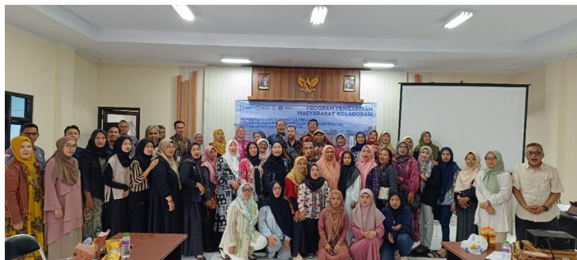
Gambar 5. Foto Bersama setelah kegiatan berlangsung

Kegiatan penutup dilakukan dengan melalui pemberian give away bagi peserta pelatihan, foto bersama dengan peserta Pelatihan dan pembuatan laporan kegiatan pengabdian masyarakat.