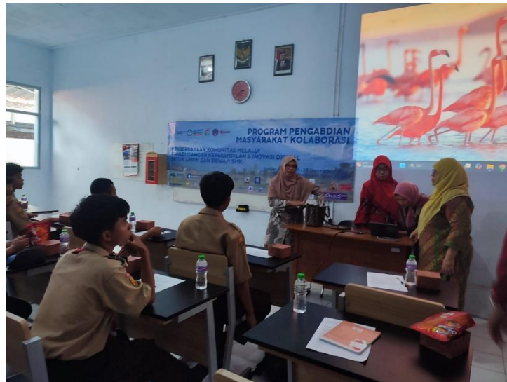
Gambar 4. Kegiatan Praktek