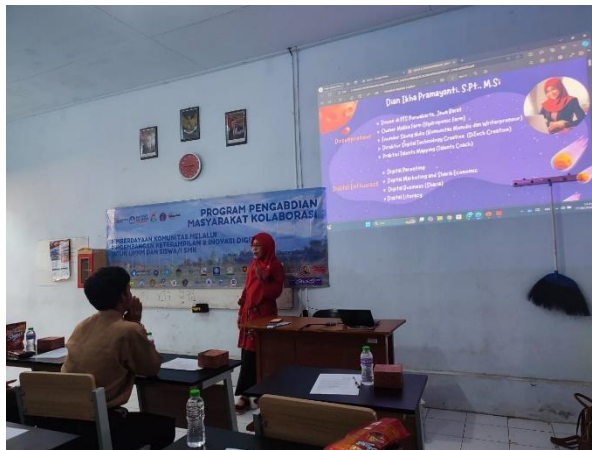
Gambar 3. Penyampaian Materi oleh Dosen

Program Pengabdian kepada Masyarakat (P2M) merupakan kegiatan yang dilakukan baik oleh Lembaga ataupun Mahasiswa/i Politeknik LP3I Jakarta sesuai dengan program studi Administrasi Bisnis dan berkolaborasi dengan STAI Al Muhajirin Purwakarta, Universitas Esa Unggul, STIEBS Al Amin Tasikmalaya dan Politeknik Tri Mitra Karya Mandiri (TMKM). Adapun peserta kegiatan P2M yang dilaksanakan di ruang Aula SMK Karya Nasional Kelas XII sejumlah 25 Siswa.